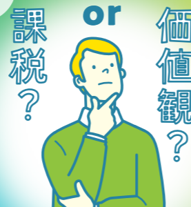
経済・政策研究室

日常生活の中で環境を汚しても追加料金を求められることはありません。では課税したらいいのか、それとも人々の価値観を変える方が効果的か。人間の行動を変える政策や考え方について研究します。