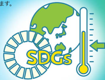
地球持続性統合評価研究室

世界の人口・社会経済の将来予測によって、食料・水・エネルギー・土地・鉱物資源などの利用量が変わります。気候変動やSDGsに関する地球規模の持続可能なバランスについて研究します。