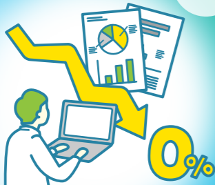
脱炭素対策評価研究室

今後のさらなる気候変動を抑えるためには、世界の温室効果ガス排出量をゼロにすることはなりません。ゼロまで減らした社会(脱炭素社会)の実現に必要な政策や技術について研究します。