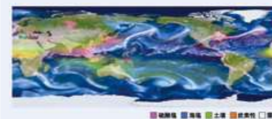
図1 全球3.5kmの高解像度NICAM-Chemで計算をしたエアロゾルと雲の分布

そこで私たちのグループは、このようなエアロゾルの複雑なふるまいを高解像度でシミュレーションするために、NICAM-Chemというソフトウェアを開発してきました。これは、地球全体の雲の動きを高精度に計算するNICAMという既存ソフトウェアに、エアロゾルの発生・移動・化学変化・消滅などを計算する機能を加えたものです。計算を高解像度で行うことができたのは、まさに「京」を使ったからです(図1)。